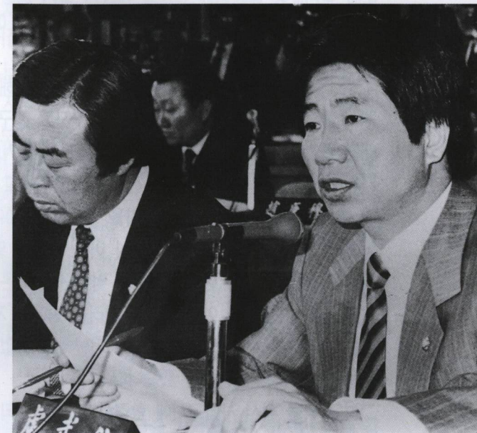
▲ 88년 5공비리 청문회

노무현은 제1야당의 대변인, 기획조정실장, 최연소 최고위원, 부총재를 거치며 꾸준히 경륜과 관록을 쌓아 왔고 또 여러번에 걸쳐 국회의원 공천 심사를 해 온 힘이 있습니다. 또 노무현은 첨단 정보화 시대에 맞는 새로운 정치 스타일을 연구해 왔습니다. 「뉴리더」라는 컴퓨터 프로그램을 직접 설계하여 명실상부한 정보화시대 정치의 장을 개척해 나가고 있습니다.