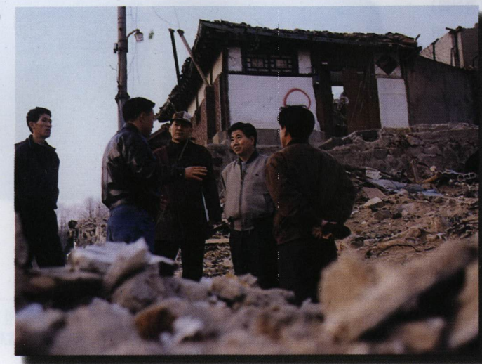
종로지역의 재개발 재건축 현장에서