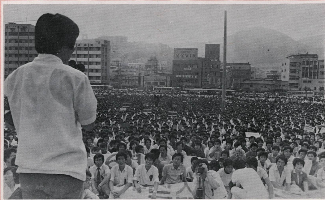
지난해 7월 9일 부산역 광장에서 거행된 고 이한열 열사 추모집회에서 독재정권의 잔학상을 비판하고 있는 노무현 변호사.

이른바 ‘부림사건’의 변론 —. 81년, 출범한 지 한 돌을 맞은 제 5공화국 정권이 부산지역의 양심적인 청년 학생들을 몽땅 잡아다 온갖 고문으로 사건을 조작하여 5년, 7년씩 감옥에 넣어버린 사건이었다. 매를 얼마나 맞았는지 온 몸이 시커멓게 멍이 들고 발톱이 새까맣게 죽어버린 청년들. 그리고 어느날 갑자기 사라진 채 57일 동안이나 소식이 없는 아들을 찾아 산성 골짜기로, 영도다리 밑으로 미친듯이 헤매고 다닌 어머니들 —. 누가, 무엇 때문에 이들을 이토록 처참하게 짓밟았는가?