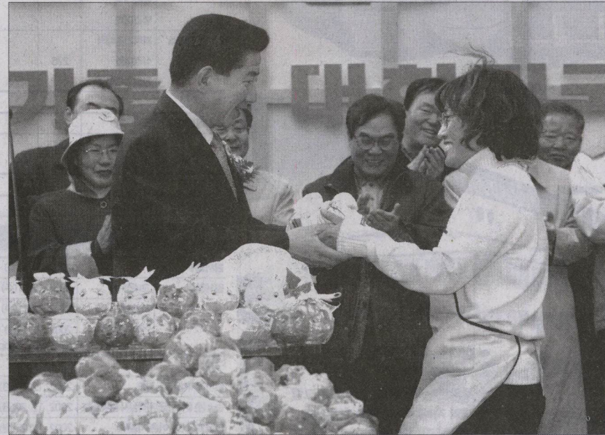
한푼 두푼 모은 국민의 후원금을 받고 눈물을 글썽이는 대통령 후보

부패정치의 뿌리인 선거자금을 깨끗하게 만들기 위하여 국민들이 나섰습니다. 9만여명의 국민들이 한푼 두푼 저금통에 모아 후원한 금액이 11월 30일까지 40억을 돌파했습니다. 지금 무수한 국민들이 한국 정치에 대한 희망을 키우는 마음으로 희망돼지라는 후원저금통을 채우고 있습니다. 검은 돈으로 대통령이 된 후보는 결코 이권으로부터 자유로울 수 없으며 국민을 위한 대통령이 될 수 없기 때문입니다.