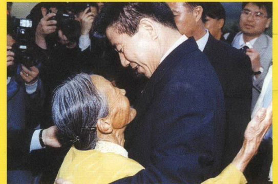
남은 곳에서 가슴을 열고 함께 토론할 수 있는 친구입니다 대통령이 필요합니다

희망은 손끝에서 나온다 누구를 선택하고 누구와 함께 하느냐가 우리의 미래를 결정할 것입니다