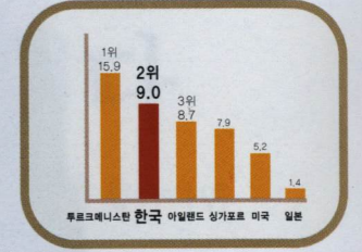
2000년 세계각국 경제성장률(단위:%)